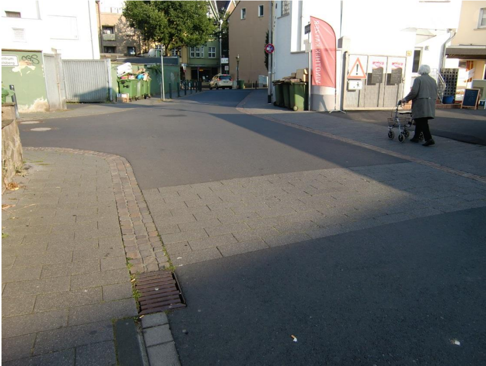
Bild 3: Blick Richtung Holzgasse auf den bereits sanierten Teilabschnitt