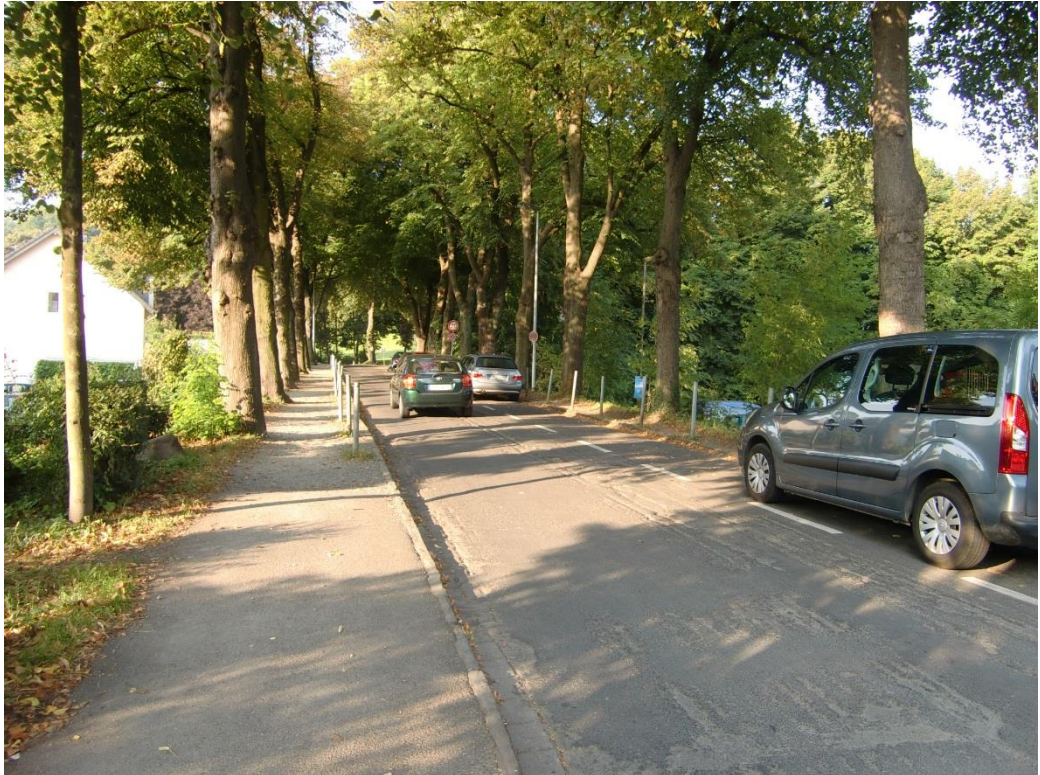
Bild 1: südlicher Streckenabschnitt (Allee), Blick Richtung Norden

Im oberen Teil der Straße finden sich Straßenabläufe beidseitig in den Rinnenanlagen. Die letzten beiden Straßenabläufe sind ca. 35,0 m nördlich der Querung der Bahngleise eingebaut. Von hier wird das Oberflächenwasser dann nur noch in die beidseitigen Rinnenanlagen abgeführt, allerdings ohne eine Ableitung über Straßenabläufe in den Kanal, so dass das Wasser frei in die Straße Neuenhof fließen kann.